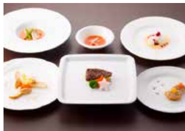
ドッグメニュー ペット栄養管理士監修のスペシャル ドッグコース。(¥4,620) ドッグメニュー単品も有(¥207~)