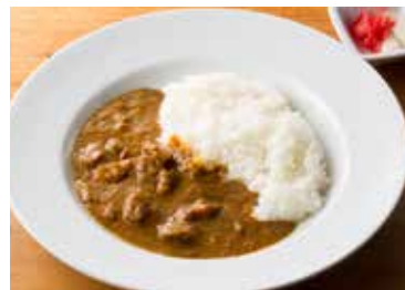
<カフェ>ランチメニュー ワフでは様々な種類のメニューを 取り揃えております。カフェで 販売中のランチセットが人気です。