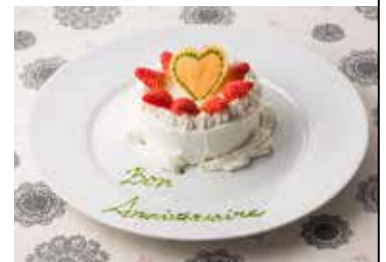
ワンコ用のバースデーケーキ 【要事前予約】¥2,310 ワンコのお誕生日もお祝いしましょう！ ご予約の際には、お名前をお知らせ下さい。