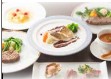
<レストラン>ディナーメニュー シェフ自慢の季節のコース